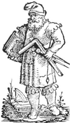
Deutscher Baumeister mit Lehrbuch, Winkelmaß und Zirkel. Holzschnitt, 1536