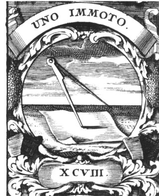
Zirkel: Das Zentrum bleibt unverändert. Barockemblem, 1702